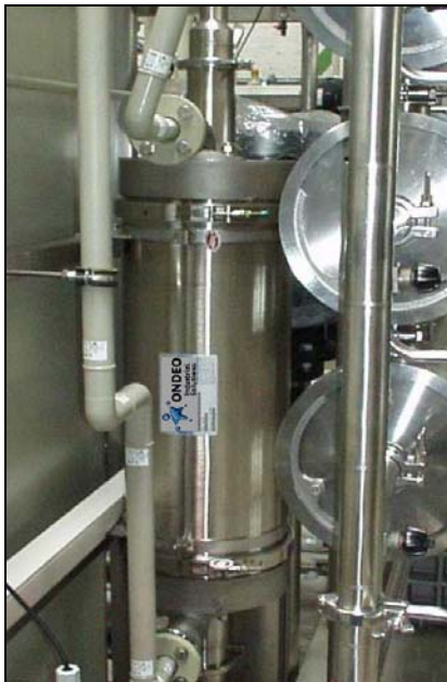
Kontaktor in einer 8m 3 /h ROCEDIS Anlage

In der Behandlung von Wasser für die Herstellung von Arzneimitteln spielt die Konzentration gelöster Gase im Wasser eine wichtige Rolle. In vielen Fällen muss der CO 2 -Gehalt im Rohwasser reduziert werden, um Reinstwasser mit einer Leitfähigkeit von <math><1,3 \mu\text{S/cm}</math> (bei einer Temperatur von 25 °C) zu garantieren.