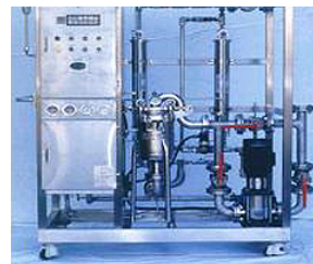
Ausrüstung für das Versuchsverfahren