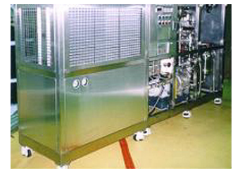
Eingesetzte Kontaktoren im KKW Wolsung