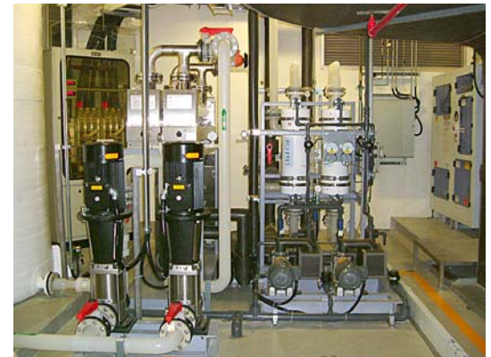
Zweite Stufe des Liqui-Cel Polishing System für CO2 und O2 Removal