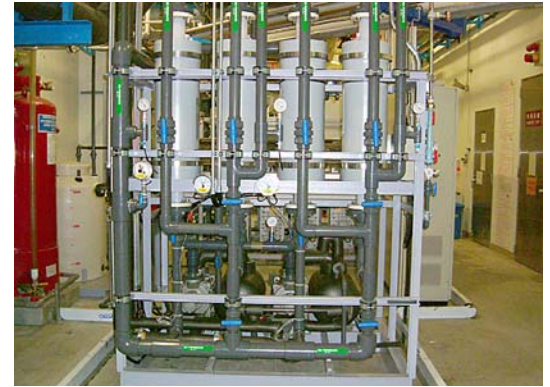
Erste Stufe der Liqui-Cel-System für die CO2-und O2 Removal